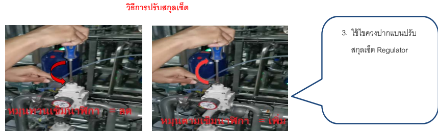
วิธีการปรับสกลูเซ็ท